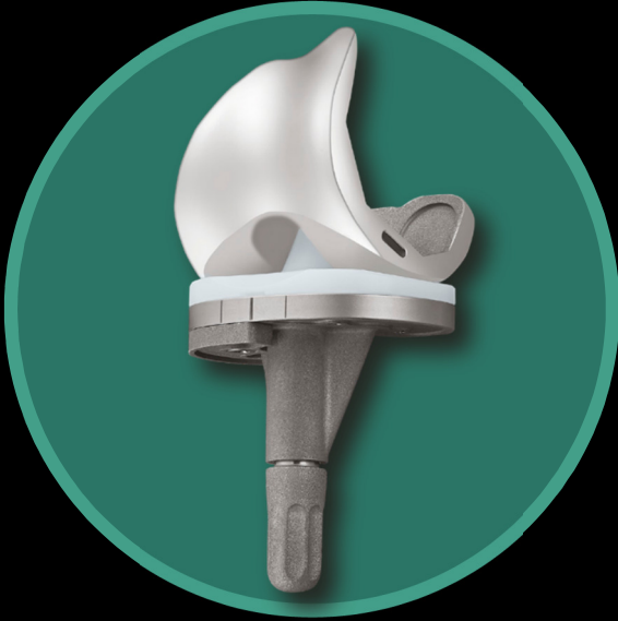
U2™ Knee with CMA Baseplate