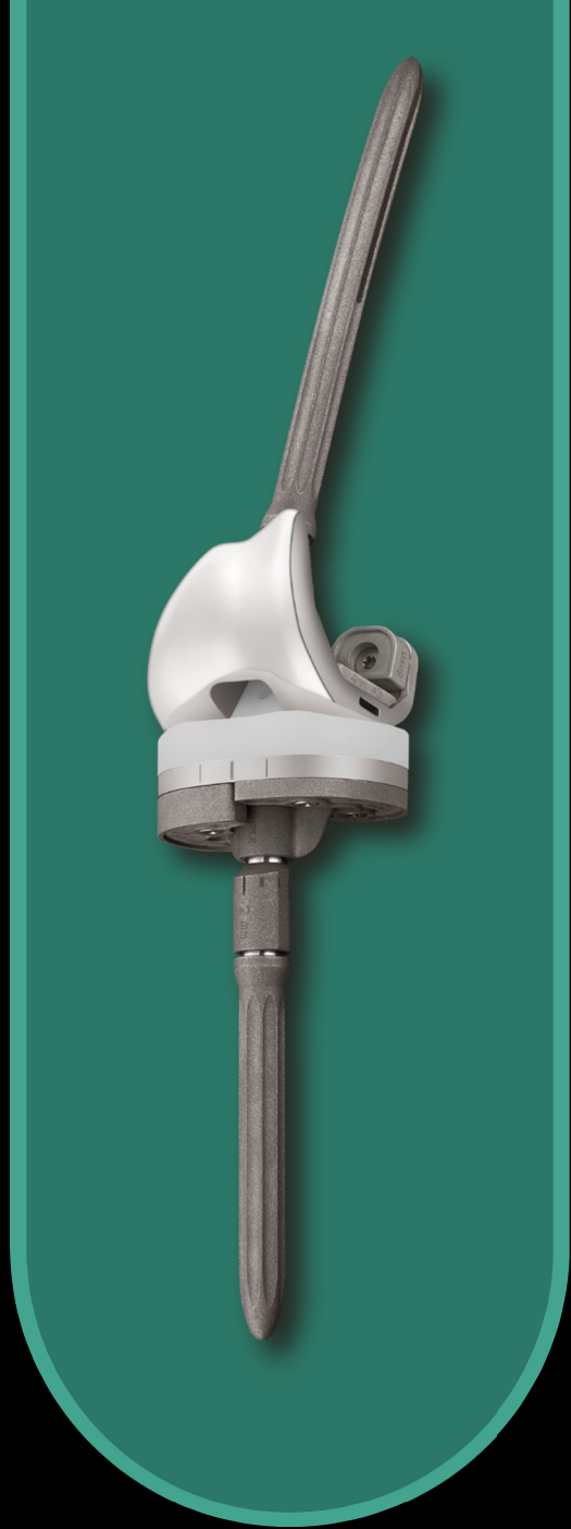
U2 PSA™ Knee Revision Knee System