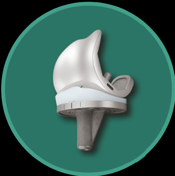
U2™ Knee Total Knee System